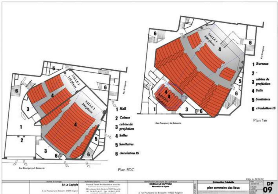
Plans des salles