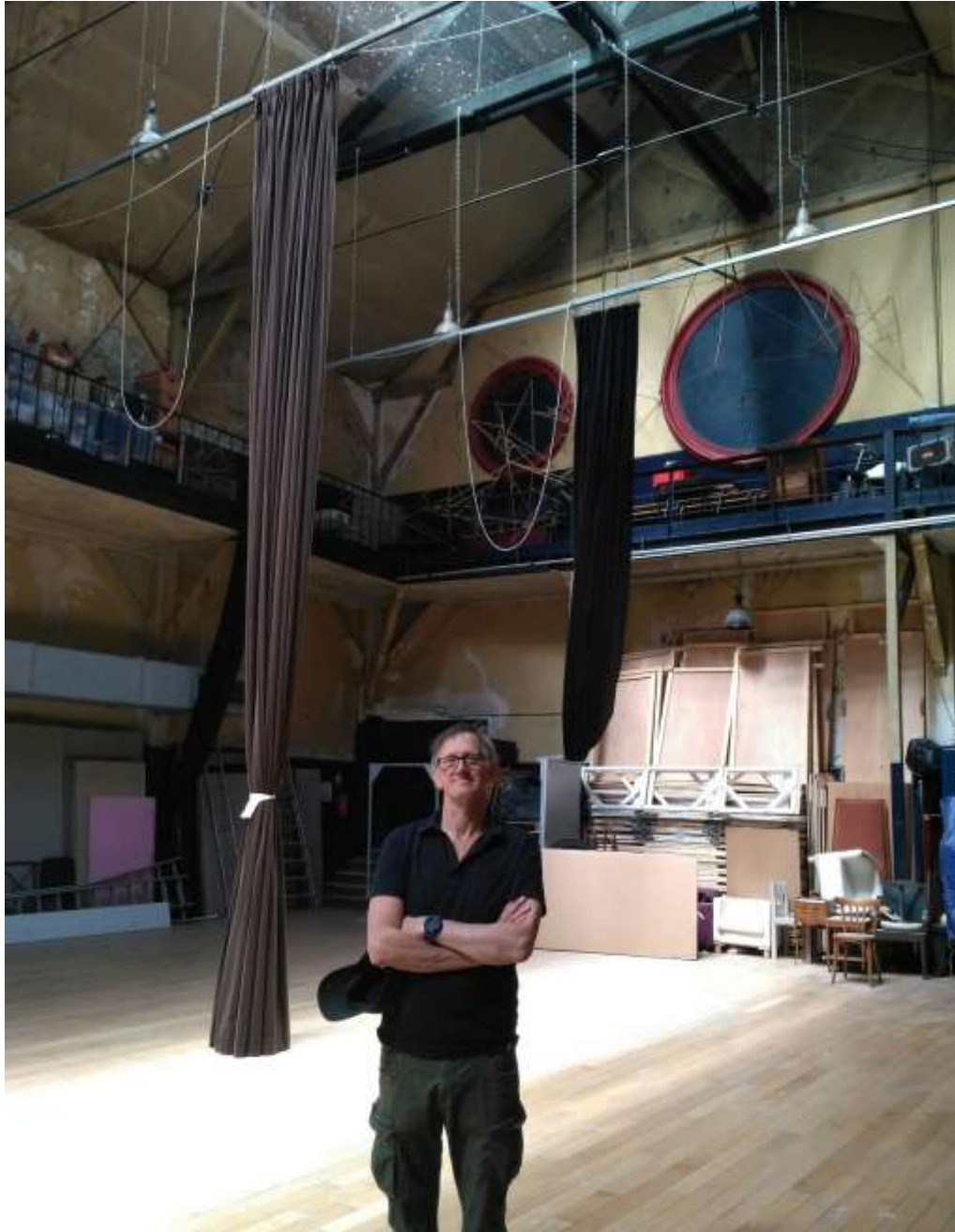
Jos dans la célèbre salle du Central de l'École Lecoq.

Depuis l'an 2000, il est revenu à l'École Jacques Lecoq, mais cette fois comme professeur !